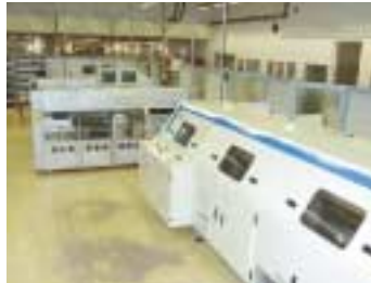
Bild 4: Zweite Inline-Dampfphasen-Lötanlage von Asscon mit vorgeschaltetem Bestückungsautomaten von Mimot

Wandlern mit 5 Anschlussbeinchen und hohem Bauteilkörpergewicht sowie Trafos notwendig. Das Beispiel eines Tape BGA mit 48 Anschlüssen ( Bild 3 ) zeigt, dass auch feinste Strukturen optimal verlötet werden können.