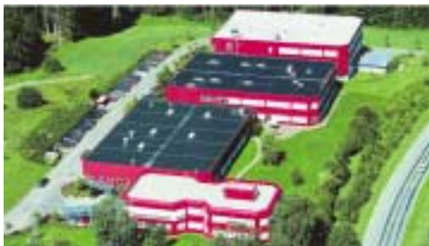
Bild 1: Das Firmengelände der TR Electronic GmbH in Trossingen nach der Erweiterung

Durch die Globalisierung der Märkte ist TR Electronic ( Bild 1 ) zu einem internationalen Unternehmen auf dem Sektor der Weg- und Winkelmessungen herangewachsen. Dies belegt auch die neuerliche Vergrößerung der Produktionsflächen durch einen zusätzlichen Erweiterungsbau. Sieht man sich die Steigerungsraten des Unternehmens an, so kann man erfreulich