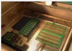
Maximale Lötflexibilität bei optimaler Anlagenauslastung

Die einzelnen Schritte des Lötvorgangs laufen in der Anlage in verschiedenen Zonen ab. Die Beladezone übernimmt nach dem Löten zugleich die Funktion der Kühlzone. Über eine Innenschleuse ist die Vorwärm- und Lötzone von der Belade-/Kühlzone getrennt. Durch die Anordnung der einzelnen Zonen ist die Lötanlage zugleich als kompakte Mehrkammeranlage ausgeführt. Sämtliche Kammern befinden sich in einer voll verschweißten Prozesszelle aus Edelstahl. Die zu lötenden Baugruppen werden auf einen Werkstückträger aufgelegt und manuell über die Frontschleuse in die Beladezone gebracht. Ab dann übernimmt die Anlagensteuerung den weiteren Prozessablauf bis zu der vollständigen Beendigung des Lötvorgangs und dem Abkühlen der Baugruppe vollautomatisch. Der Anwender gibt über die Programmparameter die