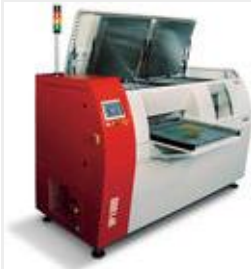
Einfachste Zugänglichkeit für Servicearbeiten

Die VP1000-66 ist die neueste Entwicklung der auf Dampfphasen-Lötanlagen spezialisierten Asscon Systemtechnik-Elektronik GmbH. Die Vorteile des Dampfphasenlötens werden mit dieser Anlage in jeder Hinsicht praxistauglich umgesetzt.